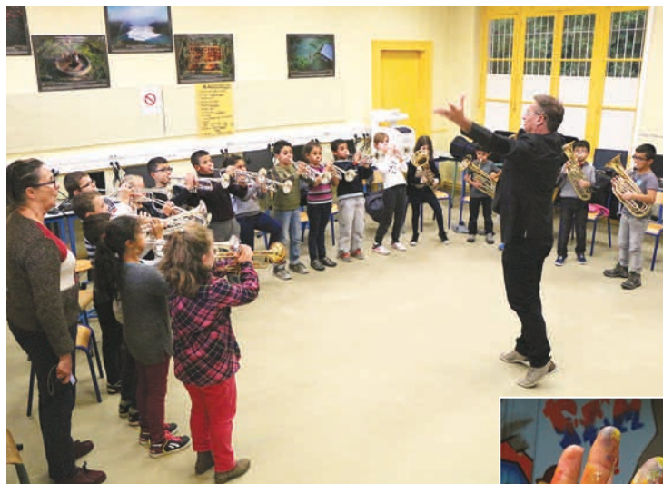
L'enfance de l'art ou comment structures culturelles du Grand Villeneuvois entrent à l'école pour apprendre aux enfants à les découvrir... et se découvrir !

Des écoliers + de l'art + beaucoup de jeu = de grands moments de bonheur. C'est la proposition élaborée dans le cadre du Contrat de Ville en faveur des écoles du cœur de ville, secteur classé quartier prioritaire. Les maternelles Saint-Exupéry et Georges-Lecomte, ainsi que les élémentaires Ferdinand-Buisson, Jean-Jaurès et Paul-Bert sont concernées, soit 562 élèves au total. L'idée : permettre à chaque classe de construire un parcours artistique et culturel en créant des passerelles avec les équipements de la ville et de l'Agglo. École d'Art, École de Musique, Centre culturel, saison Jeune public, Pays d'Art et d'Histoire, ont proposé différentes formes artistiques adaptées à chaque âge : aussi bien les arts visuels, que plastiques, ou encore la musique.