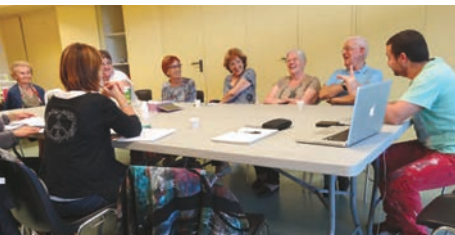
Les seniors de la Maison des Aînés ont apporté leur contribution à la notice.

C'est un médicament pas comme les autres... Son indication thérapeutique est inédite : lutter contre les préjugés. Imaginé et porté par « O.S. L'association », le projet a été élaboré en collaboration avec différents publics, handicapés physiques ou mentaux, femmes battues, homosexuels, jeunes, mais aussi des seniors de la Maison des Aînés. Le résultat : un médicament fictif, sans contre-indication, sinon celle d'ouvrir l'esprit. Sortie en pharmacie mi-décembre !