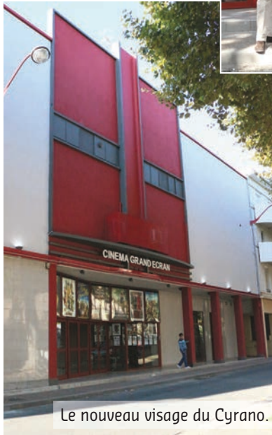
Le nouveau visage du Cyrano.

Cet automne, c'est un chantier sur le bâtiment lui-même qui a été entrepris. Et le résultat est à la hauteur des espérances. La peinture vermillon a donné un gros coup de peps à la façade jaunie, couleur reprise aussi dans le hall qui, outre une accessibilité des personnes à mobilité réduite améliorée, s'est enrichi d'un espace confiserie bien achalandé. L'autre grande nouveauté : c'est la création très attendue d'une 4 e salle. Comportant 65 places, elle permet de programmer plus de séances et donc, plus de films, plus longtemps à l'affiche.